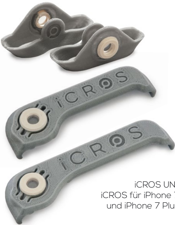
iCROS UNI, iCROS für iPhone 7 und iPhone 7 Plus

www.icros.ch www.designerei.ch press@designerei.ch ☎ +41 (0)61 922 00 21