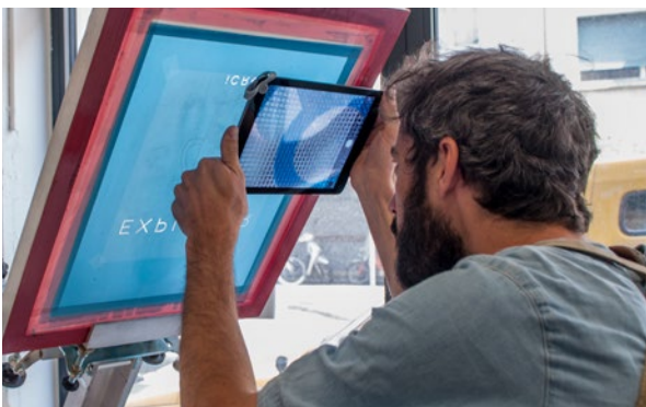
Siebdrucker mit iCROS UNI